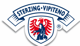
MILCHHOF STERZING LATTERIA VIPITENO